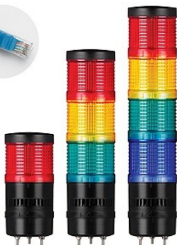
Série MS - QT - 70 - ML - ETN

MEGA SP Comércio de Sensor Eireli – ME Endereço comercial: Av. Guapira, 1823 – (Loja BMV) – Bairro Tucuruvi CEP 02265-002 – São Paulo – SP – Brasil Telefone: 11-3938-5313 – Mobile/WhatsApp: 11-97162-7722 E-mail: vendas@megasensor.com.br